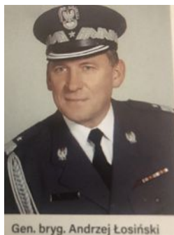
Gen. brig. Andrzej Łosiński